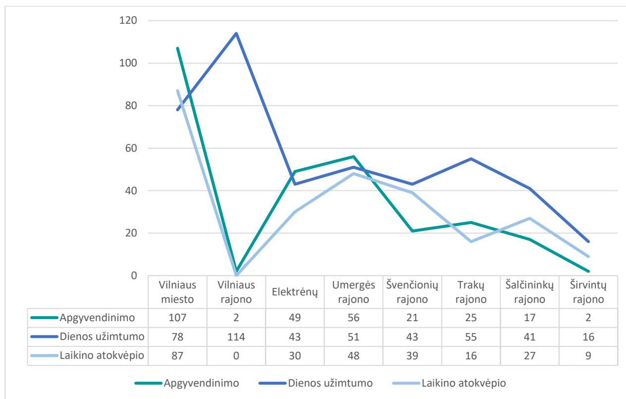
4 Pav. Apgyvendinimo, dienos užimtumo ir laikino atokvėpio paslaugų poreikis bendruomenėje gyvenantiems asmenims (artimiesiems)

Atkreiptinas dėmesys, kad šiuos duomenis reikia vertinti kaip bendrąją statistiką, todėl, kad rezultatai atskleidžia tik paslaugų teikimo, nukreipto į apgyvendinimą, užimtumą ir artimųjų poilsį, kryptis. Individualių poreikių užtikrinimui būtinas kiekvieno individualaus asmens (šeimoms) paslaugų poreikio vertinimas ir individualaus pagalbos plano sudarymas.