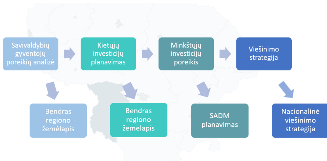
2 pav. Savivaldybių Žemėlapiuose pateiktos analizės naudojimo kryptys.